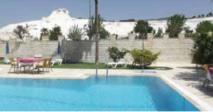
Haltur Hotel, Pammukale, 2 nits