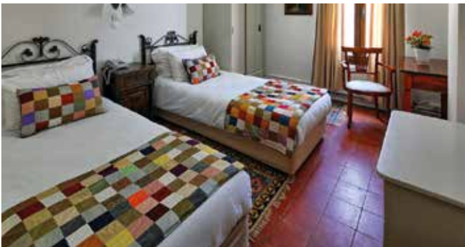
Kalehan Hotel, Èfes, 1 nit