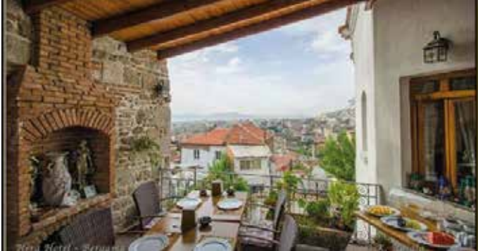
Hotel Hera, Pèrgam. 1 nit