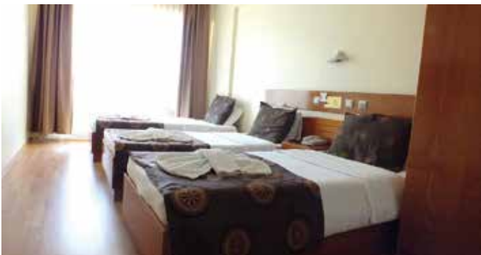
Gran Didyma Hotel, Didyma, 1 night