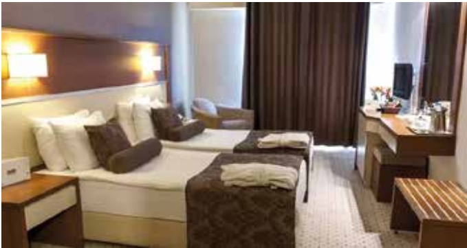
Blanca Hotel, Esmirna, 2 nits