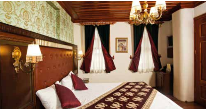
Mediterra Art Hotel, Antalya, 3 nits