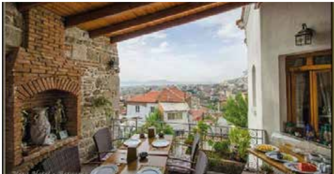
Hotel Hera, Pérgamo. 1 noche